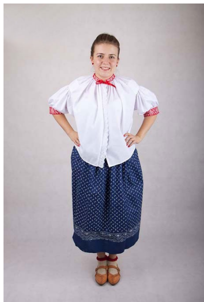
Fot. Strój damski z Beskidu Śląskiego.

Młode mieszkanki Beskidu Śląskiego chodziły zawsze z odkrytą głową. Panny splotały włosy w jeden warkocz, a w niego wplatały kolorowe wstążki. Ozdoby we włosach były najczęściej w kolorze czerwonym albo różowym. Wstążki miały różną szerokość. Na węższa była splotana razem z warkoczem, a wstążka szersza była wiązana na końcu warkocza w kokardę. Młode dziewczęta nawet w zimie nie nosiły chustek na głowie. Kobiety zamężne codziennie, bez względu na okazję, musiały mieć zakrytą głowę. Jako nakrycie głowy używało się chustek i czepków. Mężatki najpierw zaplatały swoje włosy w warkocz, który upinało się z tyłu głowy w rodzaj koka. Na gotowy kok zakładało się czepkę, a na czepku wiązało się chustkę. Czepkę miał denko w kształcie połówki elipsy, prostokątny naczótek oraz dwa zauszynki z płótna. Naczótek miał zasłaniać czoło, zauszynki i denko obejmowały ściśle głowę. Czepkę ściągało się mocno i przyczepiało do upiętego koka. Chustka zakładana na czepkę była najczęściej z jedwabiu, w jednym, góra dwóch kolorach. Chustkę można było zawiązać pod brodą albo na karku – ten drugi typ wiązania stosowało się najczęściej zimą.