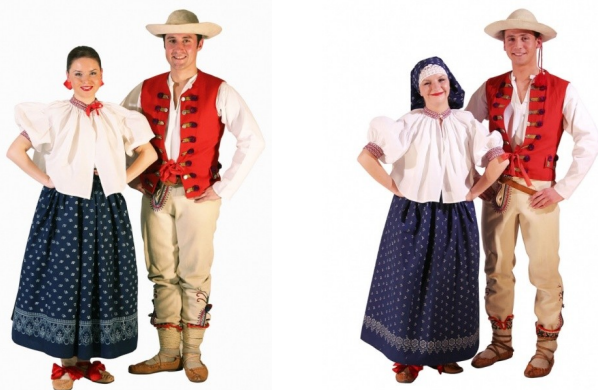
Fot. Strój górali z Beskidu Śląskiego.

Strój Górali Beskidu Śląskiego pod wieloma względami był podobny do ubioru mieszkańców innych regionów górskich. Odróżniał się przede wszystkim ozdobnym haftem – w tym regionie stosowano krzyżyk istebniański , nazywany też warkoczykowym . Był to rodzaj haftu charakterystyczny właśnie dla Beskidu Śląskiego . Haft ten powstawał w dość nietypowy sposób – najpierw pokrywało się białym haftem tło i dopiero na nim powstawał właściwy, kolorowy wzór. Najczęściej na haftach pojawiały się motywy geometryczne , potem haftowano także rośliny oraz zwierzęta , zawsze jednak dominowały zgeometryzowane formy . Koszule męskie haftowało się na czarno i brązowo, na ubraniach kobiecych haft był przeważnie czarny albo czerwony. W przypadku drelichu, adamaszku, perkalu i batystu haft umieszczano na płóciennych paskach i dopiero takie aplikacje przyszywało się do ubrań.